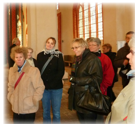
Besuch der Lorenzkirche