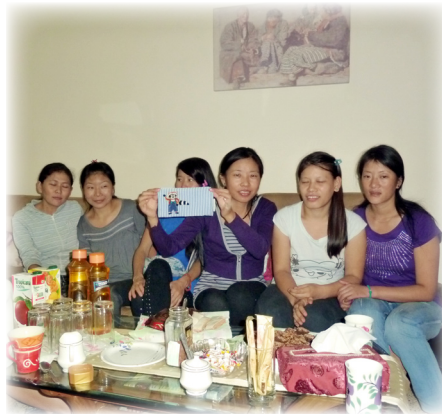
Gemütliche Wohngemeinschaft