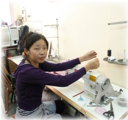
Fertigkeit an der Nähmaschine

große Fertigkeiten im Nähen entwickeln konnten, stellen sie die komplizierten Figuren Garry und Wodan her. Diese kommen mit der Post zu uns und einige unserer Klienten nähen die dazu gehörigen Schürzen, Taschen oder Federtaschen und befestigen die entsprechende Applikation. Das Ganze geschieht in unserer im September 2011 eröffneten Werkstatt „Nadelholz“ in der Brodauer Str. in Kaulsdorf.