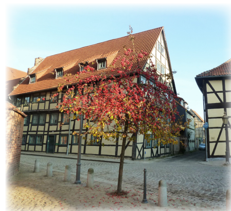
Wunderschöne Fachwerkhäuser